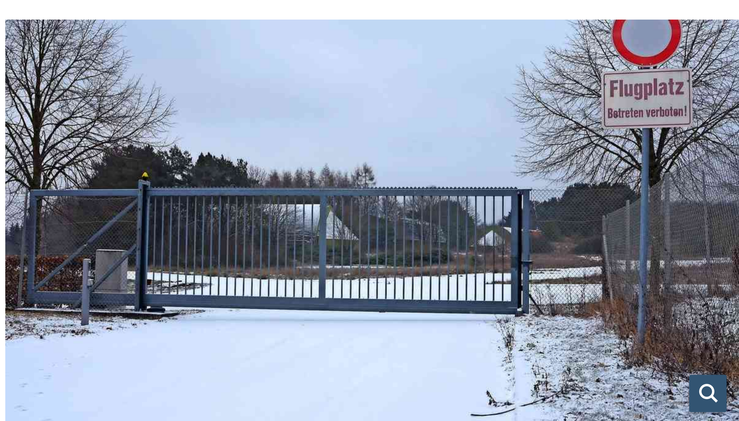
Noch geht's hier nicht weiter: Aber bald könnten auch die Gewerbeflächen im sogenannten B-Shelter verkauft werden.

28. Januar 2019 um 17:14 Uhr | Lesedauer: 4 Minuten