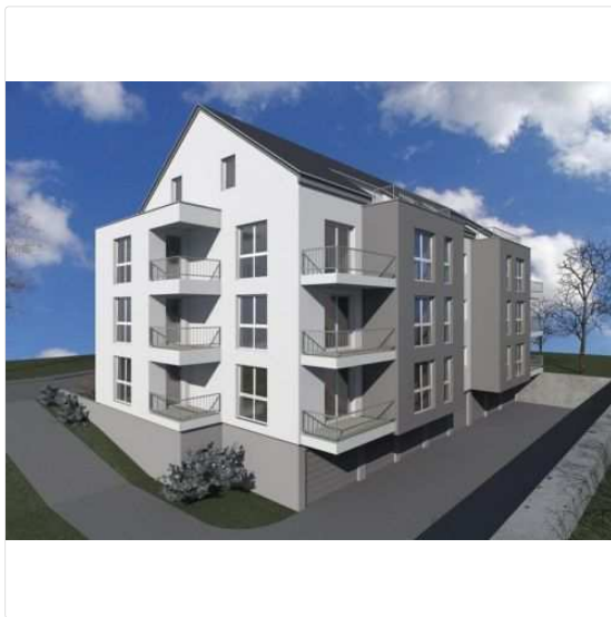
Zum Heranzoomen mit der Maus über das Bild fahren