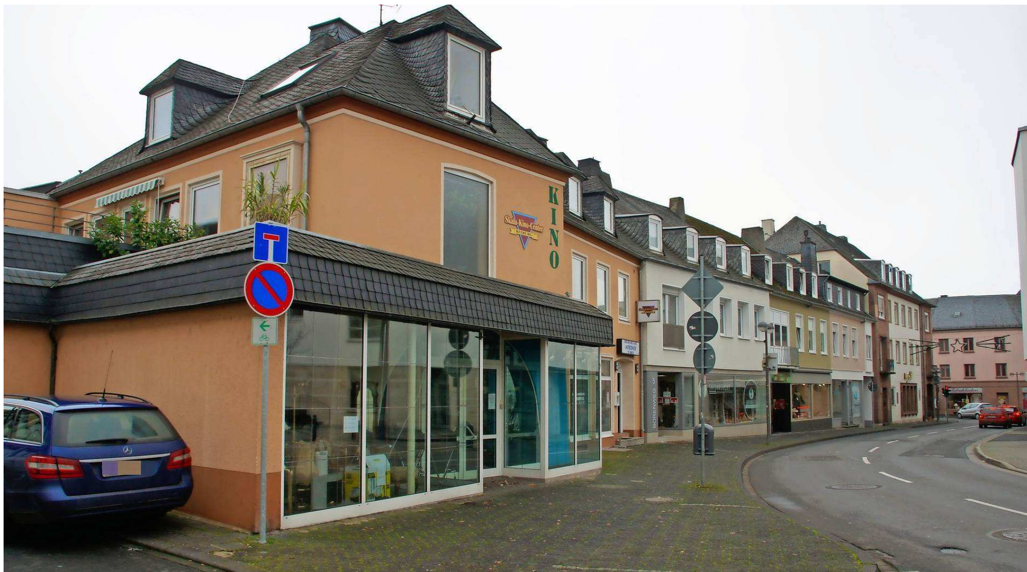
Das leerstehende Skala-Kino-Center steht zum Verkauf. Das neue Bitburger Lichtspielhaus wird aber wohl an anderer Stelle entstehen.

Bitburg. Das geschlossene Skala-Kino-Center Bitburg steht zum Verkauf. Der Kinobetreiber Kurt Römer allerdings hält an seinen Plänen für ein neues Filmtheater in der Stadt fest.