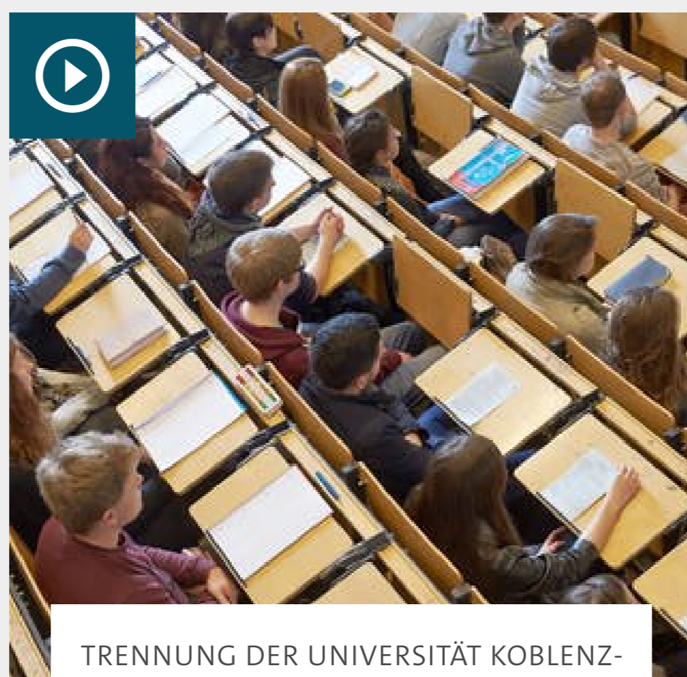
TRENNUNG DER UNIVERSITÄT KOBLENZ-LANDAU

Kabinetts bringt Gesetzentwurf für Uni-Neuordnung auf den Weg