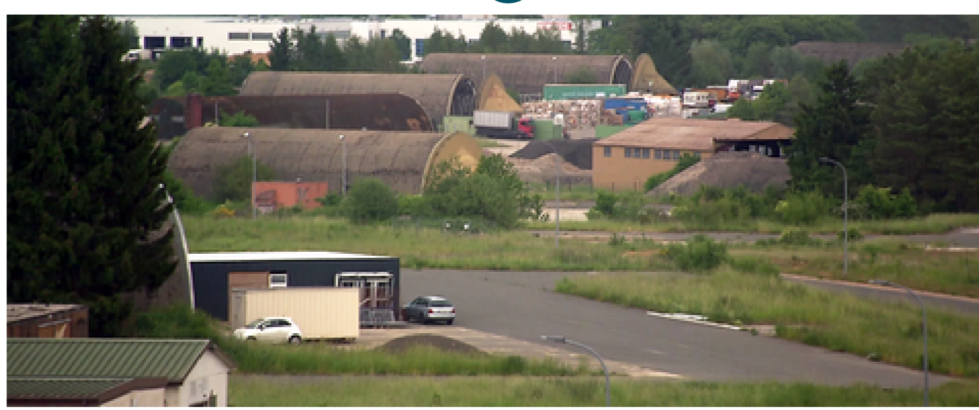
Ehemaliger Militärflugplatz Bitburg