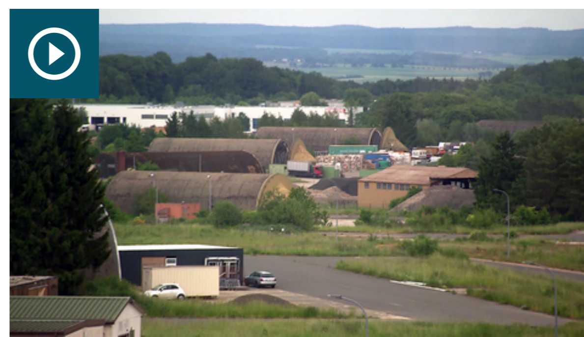
EHEMALIGER US-MILITÄRFLUGPLATZ BITBURG

Sanierung des Flugplatzes Bitburg könnte Vorbild werden